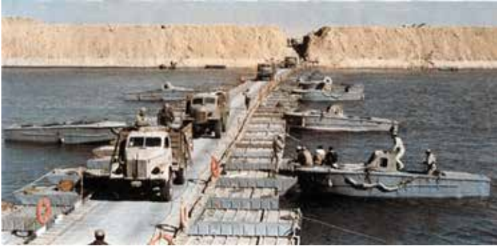
Ryc. 2. Jedna z egipskich przepraw w czasie operacji „Badr”.

manewrowanie wszystkimi jednostkami rzuconymi do hamowania postępów armii egipskiej oraz tych, które miały wykonać kluczowy manewr obronny – kontratak.