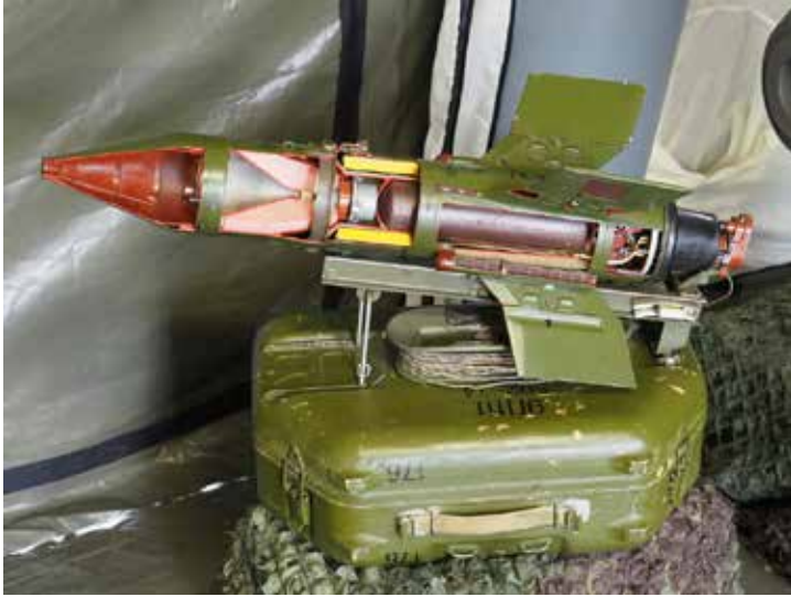
Ryc. 4. 9M14 Malutka.