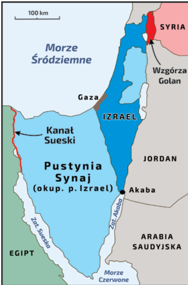
Ryc. 1. Izrael, pustynia Synaj oraz Kanał Sueski w przededniu wybuchu wojny Jom Kipur.

linii Bar-Lewa 3 . Po zakończeniu wojny sześciodniowej wywiad izraelski ocenił, że Egipt podejmie próbę odzyskania Synaju w ciągu trzech lat. Generał major Yariv trafnie odgadł, że Egipt ograniczy swoje ambicje do zajęcia jedynie części półwyspu.