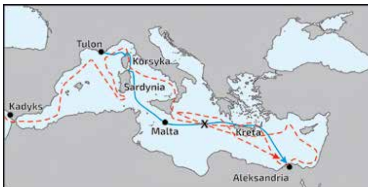
Ryc. 1. Trasy przebyte przez flotę inwazyjną Napoleona i ścigającą ją Nelsona. „X” – miejsce mianięcia we mgle 22 czerwca.

uszkodzenie masztu flagowego „Vanguarda”, zawróciły do Gibraltaru, zakładając, że reszta eskadry także tam zawróci. I tyle te fregaty widziano. Tymczasem Nelson proaktywnie naprawił swój okręt na Sardynii i został za to pokarany – stracił oczy i uszy swojej eskadry.